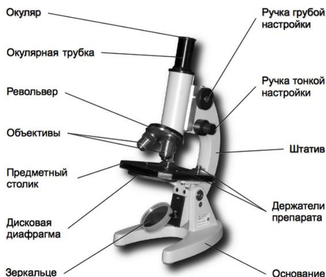
Внешний вид микроскопа Биомед 1

«Ознакомление с устройством увеличительных приборов». Демонстрация.